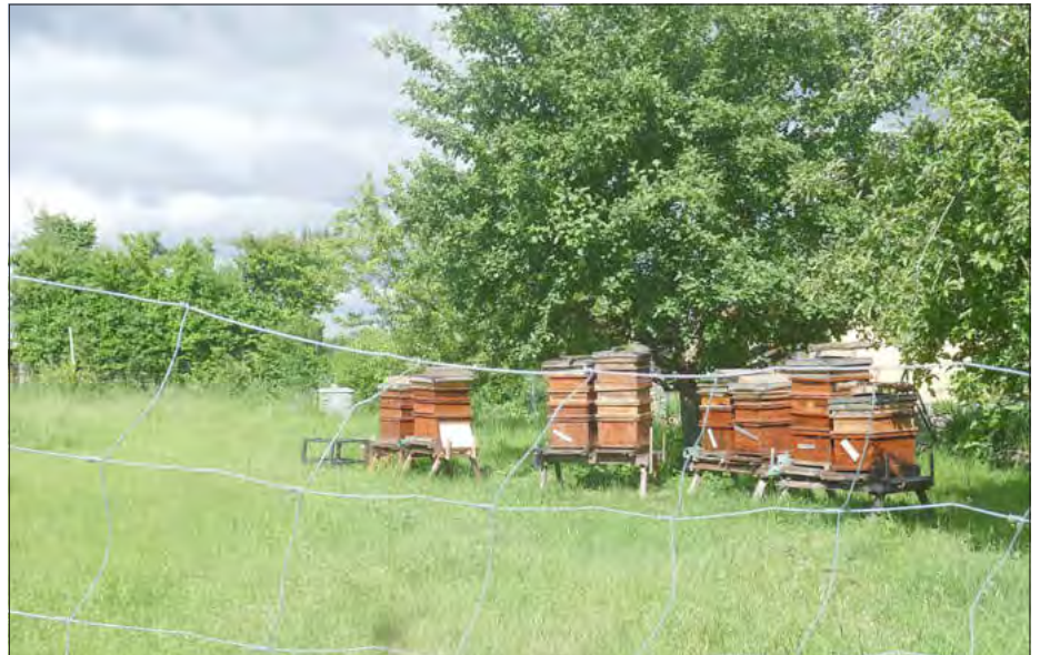
Der Besuch beim Imker und seinen Bienen war super spannend!

Wie angekündigt, gibt es Neuigkeiten zu den Vorschulkindern . Diese hatten zwei ganz wichtige Termine! Zum einen waren sie zu Besuch in der Bücherei . Hier las die Bibliothekarin wieder ein schönes Buch vor und dann wurden die Taschen mit Büchern für die Kindergartengruppen vollgepackt. Endlich neuer Lesestoff!