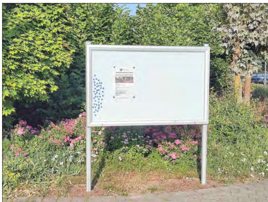
An der Mehrweckhalle steht seit Juni ein neuer, zusätzlicher Schaukasten der Gemeinde.

Neben dem offiziellen Amtskasten am Hirtenberg neben der Wertstoffinsel gibt es nun auch einen neuen Schaukasten der Gemeinde an der Mehrweckhalle . Vielen Dank an den Bauhof für die Installation! Außerdem brachte der Bauhof an der Multisportanlage Schilder an, die noch einmal eindringlich darauf hinweisen, dass diese Sportstätte nicht mit Stollenschuhen betreten werden darf. Bitte halten Sie sich an diese Regel, da sonst Schäden am Boden der Anlage entstehen.