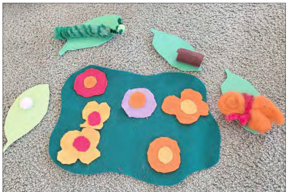
Die Metamorphose von der Raupe zum Schmetterling - die Krippenkinder haben toll gebastelt!

gerade heranwachsen lassen. Von Tag zu Tag werden diese größer und dicker. Bald werden sie sich verpuppen und wir können hautnah miterleben, wie sie durch die Metamorphose als Schmetterlinge aus dem Kokon schlüpfen.