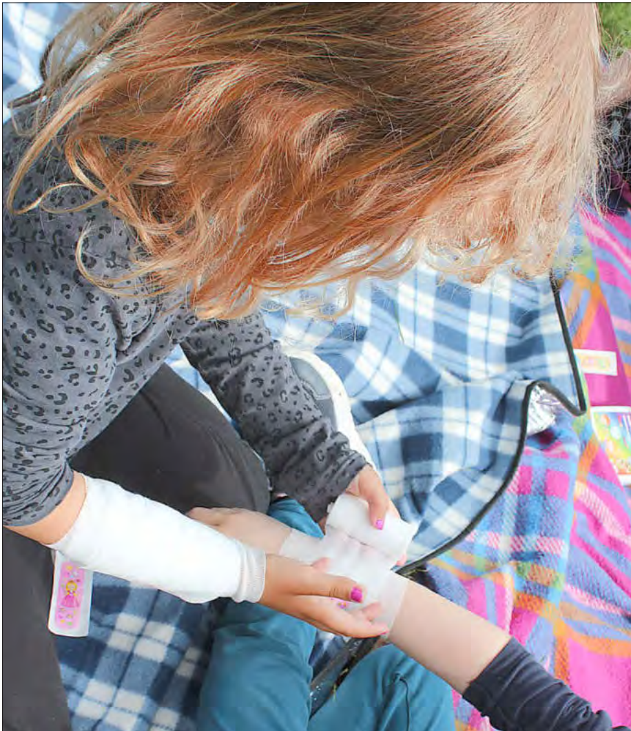
Beim Erste-Hilfe-Kurs übten die Kinder auch das Anlegen von Verbänden.

Und tags darauf ging es gleich weiter mit einem Erste-Hilfe-Kurs . Die Erzieher haben nicht schlecht gestaunt als die Vorschulkinder mit Verbänden und Pflastern in die Gruppen zurückkamen. Sie sollten doch lernen wie man in Notfällen richtig handelt und nicht mit Verletzungen zurückkommen! Die Erleichterung folgte allerdings auf den Fuße, als die Erzieher erfuhren, dass die Kinder bei sich gegenseitig nur geübt haben, wie ein Verband richtig anlegt oder ein Pflaster auf eine Wunde geklebt wird. Zusätzlich haben sie gelernt, welche Nummer man in einem Notfall wählen muss und welche Informationen man der Feuerwehr oder der Polizei geben muss, damit sie ihren Einsatz so einfach wie möglich abwickeln können.