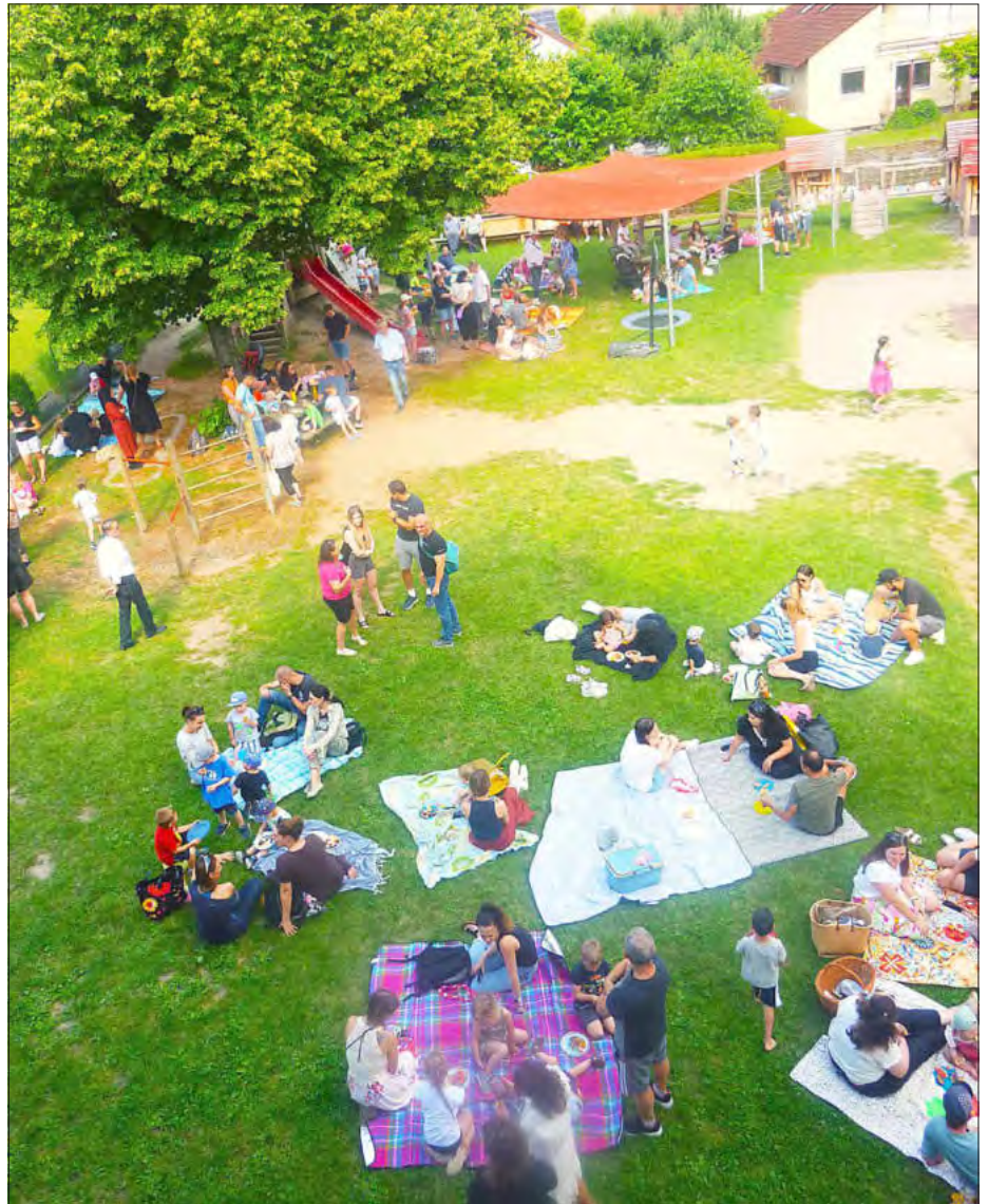
Aus dem ausgefallenen Sportfest wurde ein gemütliches Picknick mit den Eltern, bei dem die Gruppen ihre lange geübten Aufführungen zeigten.

Es sind schon tolle Ideen dabei. Aber psst.. wir dürfen natürlich erstmal nichts verraten, denn das soll eine Überraschung werden...!