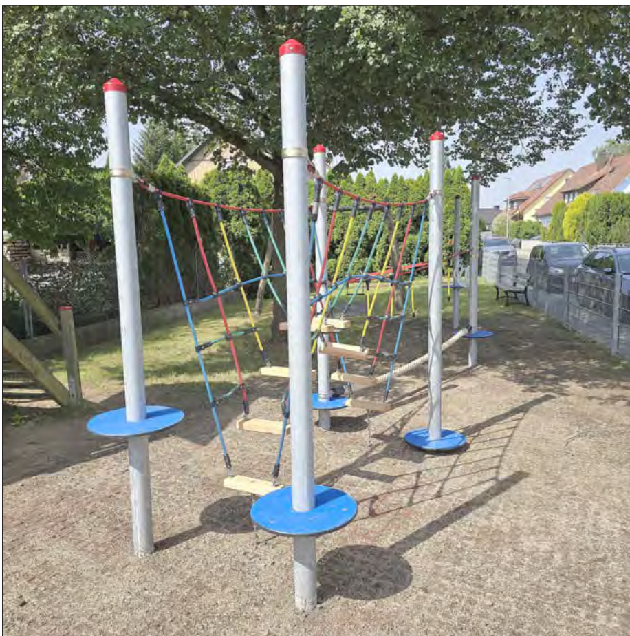
Wurde um einen Kletterparcours für Kinder erweitert: der Spielplatz Hutweg.