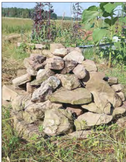
Eine Steinpyramide ist einfach zu bauen.

Neben der Artenvielfalt hat Totholz noch weitere positive Eigenschaften: Das Holz zersetzt sich, es entsteht Humus. Nährstoffe und Spurenelemente werden freigesetzt, die die Bodenfruchtbarkeit verbessern. Besonders wichtig ist es, das Totholz über viele Jahre hinweg liegen zu lassen, damit die natürlichen Zersetzungsprozesse in allen Stadien, bis hin zur Mulm- und Humusbildung ablaufen können.