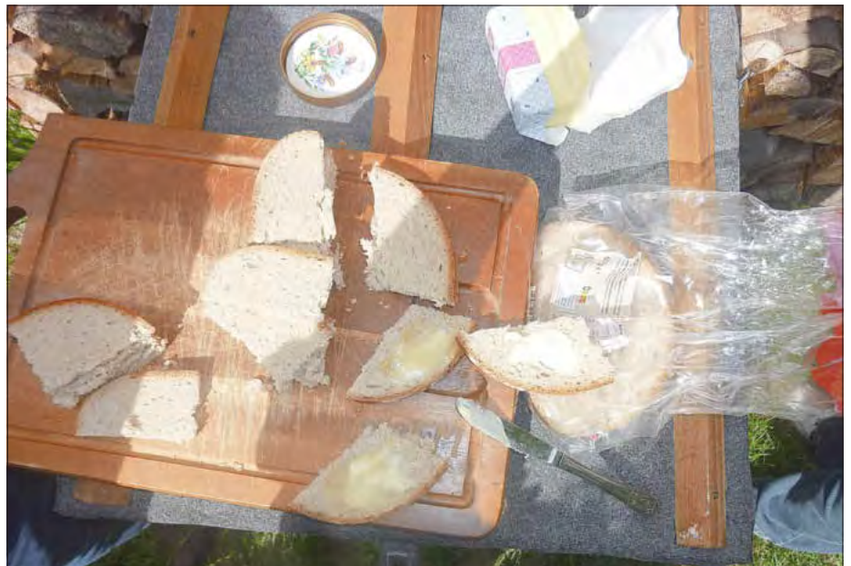
Zum Abschluss durften wir frischen Honig probieren! Lecker!